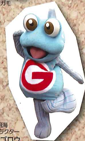
佐賀県・有明海 非公認キャラクター 有明ガタゴロウ