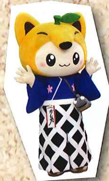
鹿島市 イメージキャラクター かし丸くん