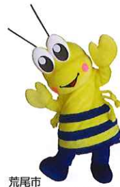
荒尾市 マスコットキャラクター マジャッキー