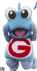
佐賀県・有明海 非公認キャラクター 有明ガタゴロウ