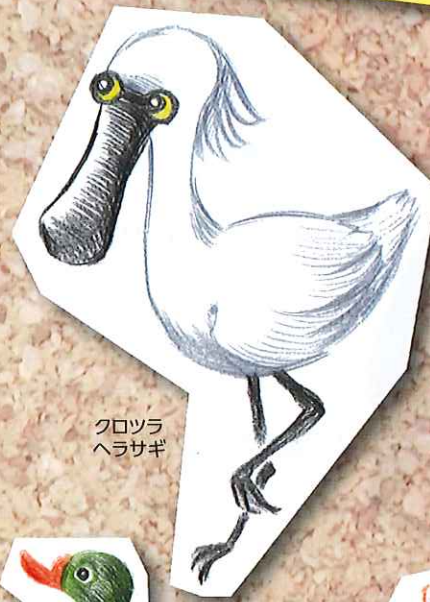
クロツラ ヘラサギ