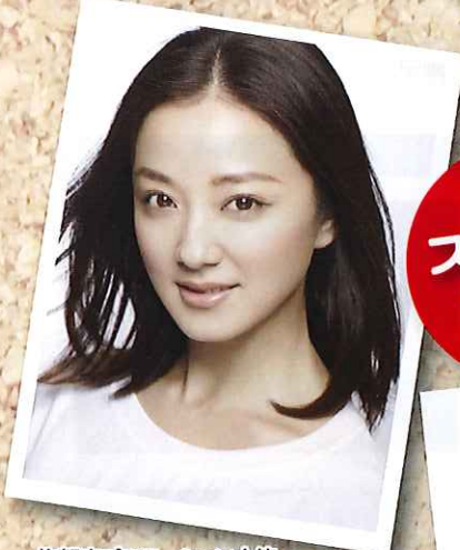
佐賀市プロモーション大使 女優 中越 典子さん