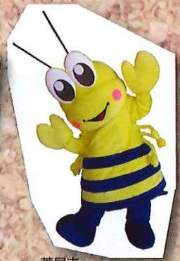
荒尾市 マスコットキャラクター マジヤツキー