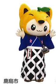
鹿島市 イメージキャラクター かし丸くん

この度、有明海に面する佐賀市の東与賀町で国際的なシンポジウムが開催されることになって、有明海に住んでる生き物としてはほんなこって嬉しさがタア。それだけこの母なる有明海が注目されてるってこと！ 歓喜と共に責任も感じてるガタよお。 いつまでもこの美しい干潟を守っていけるようオイたちも全力で頑張るし、みなしゃんもぜひ協力してほしガタア。